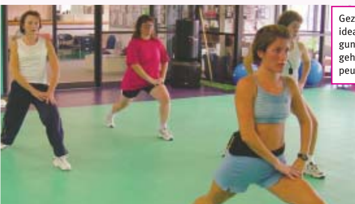
Gezielte Bewegung ist das ideale Mittel zur Vorbeugung von Osteoporose und gehört auch zu den therapeutischen Maßnahmen

dichte beeinflusst werden kann. Gleichzeitig lassen sich sturzrelevante motorische Fähigkeiten verbessern. Körperliche Aktivität ist von nahezu jedem ohne Risiko zu praktizieren und kostengünstig und führt zu vielen weiteren positiven gesundheitlichen Effekten. Nur wenn wir es schaffen, flächendeckend Präventionsstrategien zu entwickeln, die auf einer generellen Änderung des Bewegungsverhaltens basieren und ferner spezielle Osteoporose wirksame Sport- und Bewegungsprogramme beinhalten, wird sich die Kostenwelle, die auf uns zurollt, aufhalten lassen.